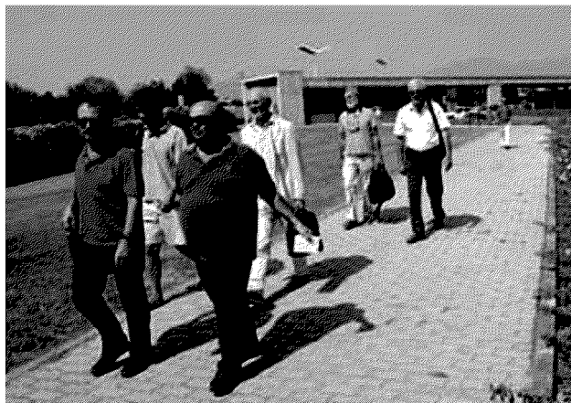
L'incontro A2A ha convocato i comitati ambientalisti all'inceneritore

Al momento le ceneri vengono spedite nelle miniere di salgemma in Germania al costo di 130 euro a tonnellata. La fase sperimentale dell'impianto dovrebbe iniziare nel 2013.