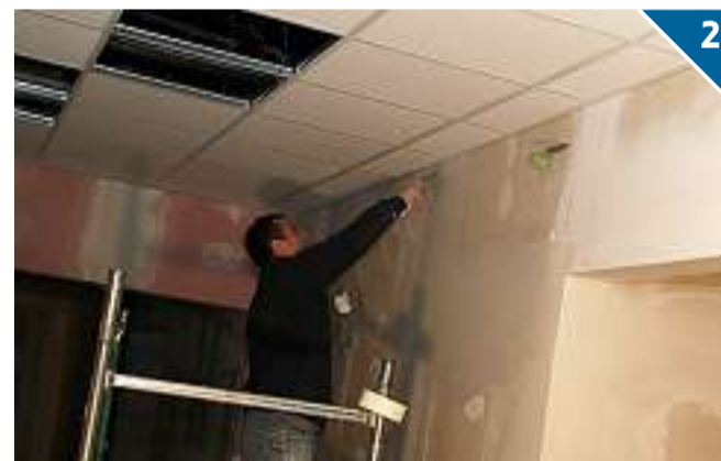
GLI IMPIANTI. L'impianto di riscaldamento è già partito, gli altri sono al traguardo. Pure la posa dei pavimenti in ceramica è iniziata, mentre l'ultimo atto sarà la posa di quelli in gomma che partirà dal primo piano.