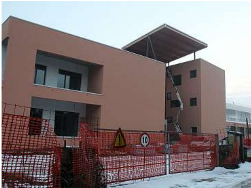
L'ingresso principale della «Arici Segà» sarà dal lato Nord, su via Fiorentini

Maione: «Standard elevati Un passo avanti della città nel sistema del welfare»