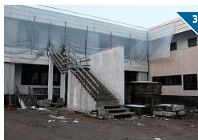
IL CENTRO DIURNO. Al piano terra è previsto anche lo spazio destinato ad un Centro diurno integrato che ospiterà gli anziani durante la giornata (con grande sala multifunzionale, sale pranzo, soggiorno e riposo)