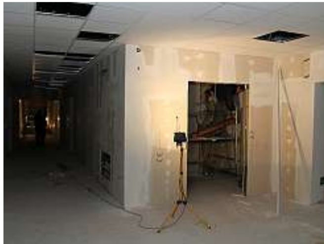
Un corridoio di accesso alle camere della nuova Rsa

Assegnati gli ultimi incarichi, entro fine anno sarà chiuso l'involucro e verranno montati i serramenti. Termine lavori entro il 31 marzo